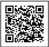
若者雇用促進総合サイト