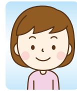
国立大学法人/総合職 (大学)

書類添削を何度もしていただきました。ただこう直したほうが良いとアドバイスをしてくれたのではなく、お話しする中で私がどう思うか、どう書くかを書きたいのか引き出していただき、結果として満足できるESが書けました。感謝しています。