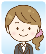
ホテル/フロント (短大)

利用したメニュー：職業相談40回 書類添削8回 模擬面接8回 業界研究座談会 参加