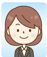
製造/生産管理事務 (大学)

どうしたら良いか分からなくなった時は、就活に関係ない話でも付き合ってくれたり、行きたいところが決まった時には一番近くで支えていただきました。ハローワークに来ていなかったら、ここまで気持ちを保ってやってこれなかったと思います。