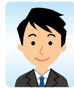
研究機関/総合職 (大学)

スタッフの方々が一緒に考え、話し合ってくれたり、様々な求人を紹介してくれて大変助かりました。