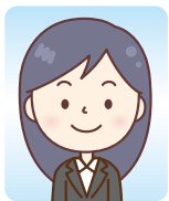
公益財団法人/総合職 (大学)

ここでご紹介するのはほんの一部です。 福島新卒応援ハローワークには、たくさんの 「内定者の声」が寄せられています！