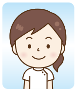
福祉施設/介護職 (大学)

初めての利用ですごく緊張していたのですが、とても親切に対応していただきました。自分の良い所もわからない事だらけだったのですが、引き出してくれるなど、自分探しもできました。面接練習も本番みたいで、本当の面接でも緊張せずにできました。ありがとうございました。