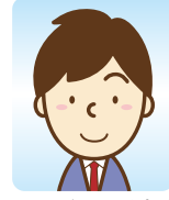
サービス/総合職 (大学)

利用したメニュー：職業相談6回 書類添削2回 模擬面接2回 就活応援セミナー 参加