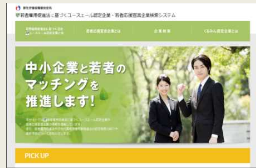
「ユースエール認定企業・若者応援宣言企業検索システム」

URL : https://www.wakamono-saiyou-ikusei.go.jp/search/service/top.action