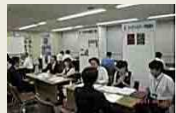
【企業説明会の風景】

また、大卒等就職情報WEB提供サービスでは企業説明会やハローワークの出張相談会などイベント情報の掲載を行っています。こちらもぜひご活用ください。